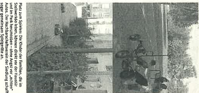
Platz zum Spielen: Die Kinder der Familien, die im Stellwerk leben, können direkt vor der Haustür und im Park herumtollen – ohne Angst vor „schlechten Autos“. Der Nachbarnschaftsverein der Siedlung schlägt gegen gemeinsam Spielgeräte an.

Man spart sich den Transport von schweren Markten/Käufen und muss die Lieferung oft nicht einmal selbst annehmen, sie wird einfach in den Garten oder vor die Haustür gestellt. Man unterstützt regionalen Bauern und den Bioanbau.