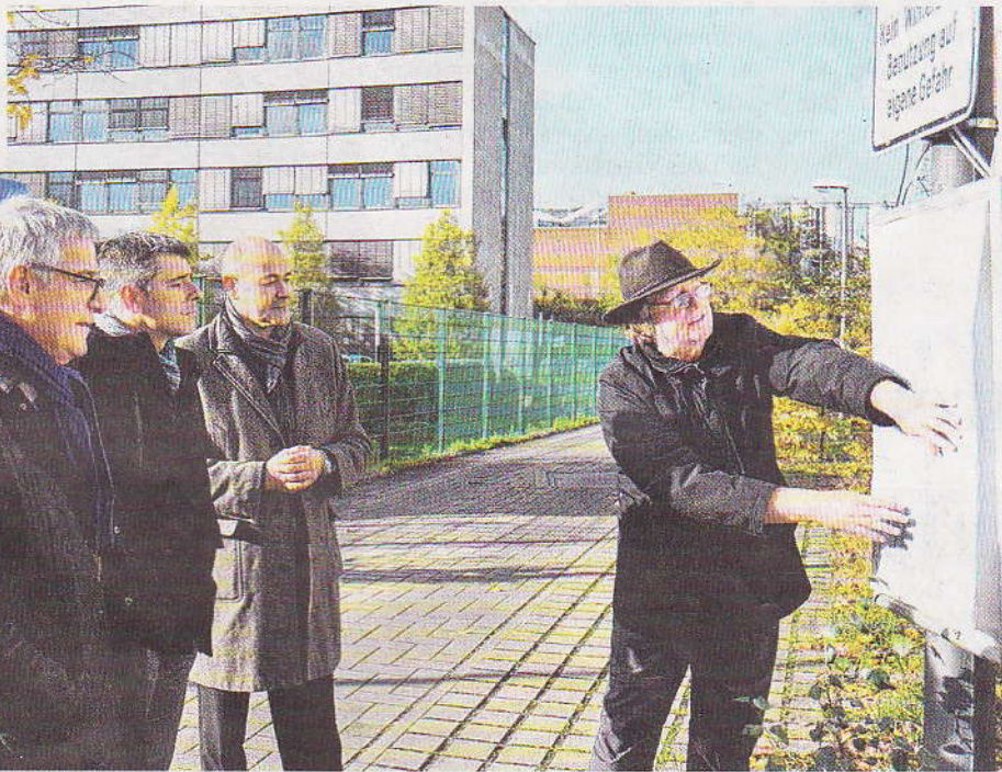
Senatoren des französischen Senats machten einen Abstecher von der UN-Klimakonferenz zur Autofreien Siedlung in Nippes, dem einzigen Öko-Quartier der Stadt.