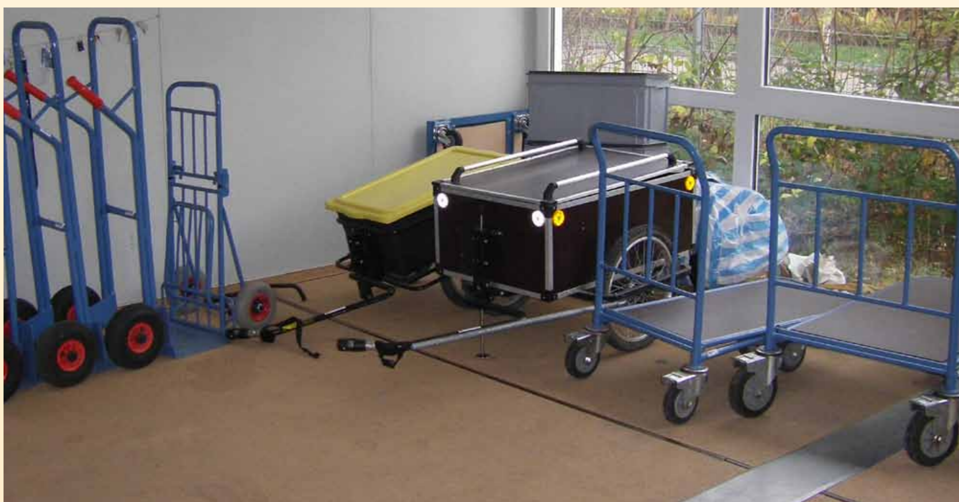
Blick in die Mobilitätszentrale