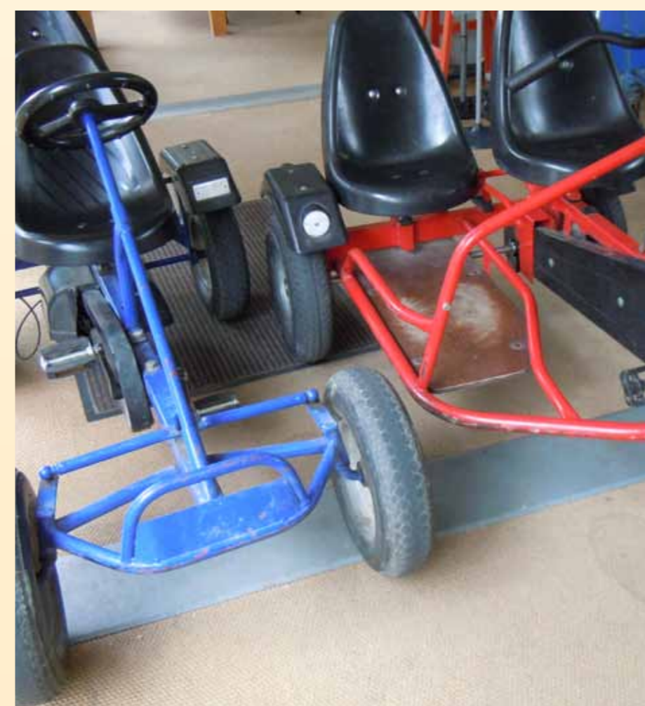
Sehr beliebt bei den Kindern