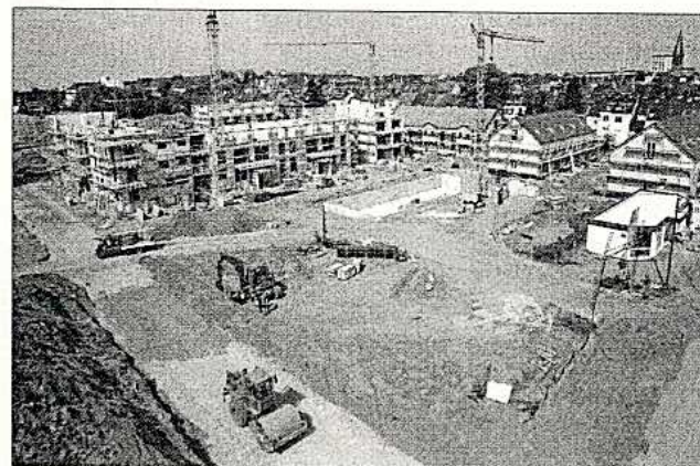
Bauarbeiten: Die ersten Häuser stehen schon.

Ende 2005 wurde mit dem Bau begonnen: Auf einem Gelände von 40 000 Quadratmetern – rechnet man den daneben gelegenen öffentlichen Park hinzu, sind es sogar 60 000 – soll eine grüne Siedlung mit Spiel- und Verweilräumen entstehen, in der Wege und Plätze als Orte der Begegnung dienen. „Wir setzen auf eine Durchmischung der Wohnformen, nicht auf eine Monokultur, das ist eine der Besonderheiten des Projekts“, erläutert Schwerdtner, „hier können Familien, Paare und Singles aller Altersstufen miteinander leben“. Es wird verschiedene Einfamilien-